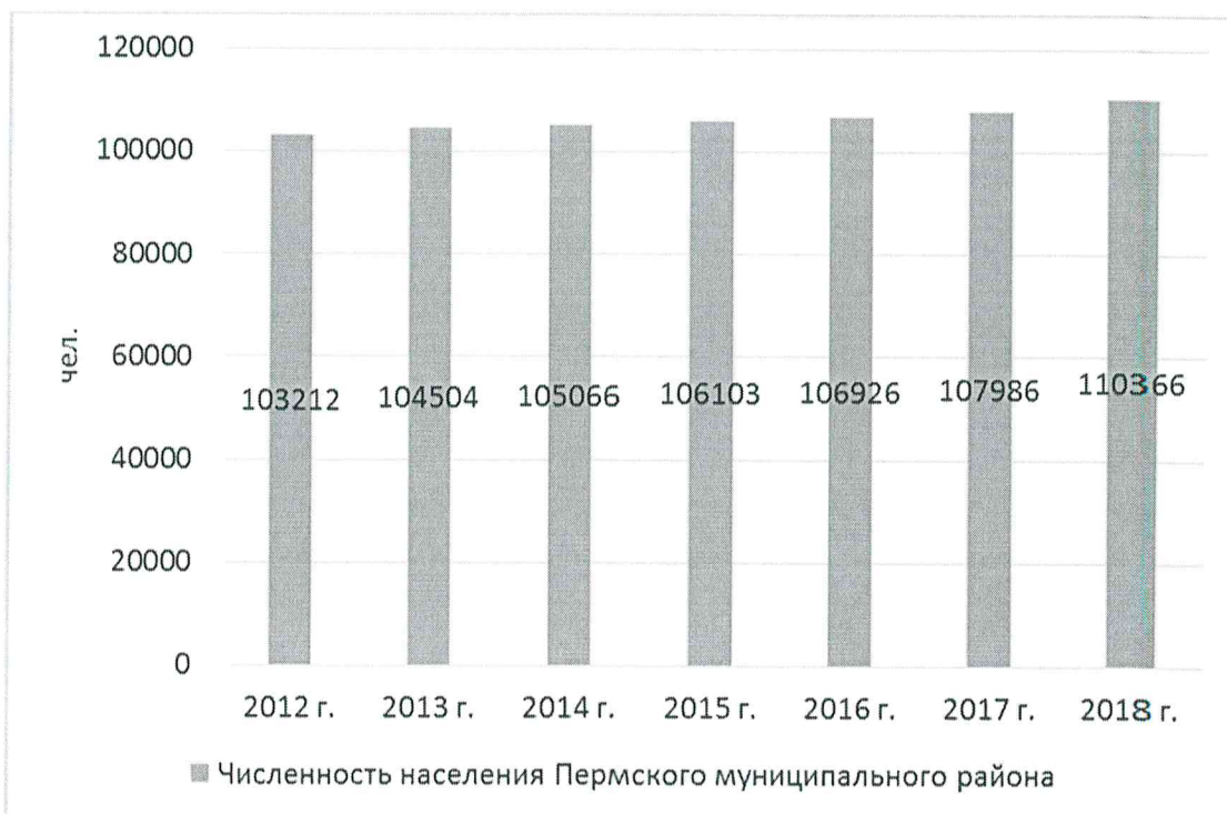
Рисунок 2.1 Динамика численности населения Пермского муниципального района Пермского края в 2012-2018 годах (данные на начало года)

Все население Пермского муниципального района относится к категории сельского населения.